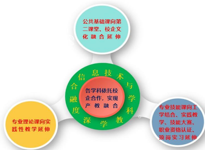
“三延伸两融合”教学模式图示

课堂和校企文化融合延伸”、“专业理论课向实践性教学延伸”、“专业技能课向工学结合、技能展赛、顶岗实习岗位技能延伸”、“信息技术与教学融合”、“产教融合”的“三延伸两融合”教学模式改革实践，充分利用数字化教学资源、校企合作资源，推进本专业开展项目教学、案例教学、情境教学、模块化教学、仿真模拟教学等教学方式，广泛运用启发式、探究式、讨论式、参与式等教学方法，逐步推广翻转课堂、混合式教学、理实一体教学等新型教学模式，加大实践教学力度，做好专业实训教学超过50%，提高课堂教学质量，强化学生职业技能训练。